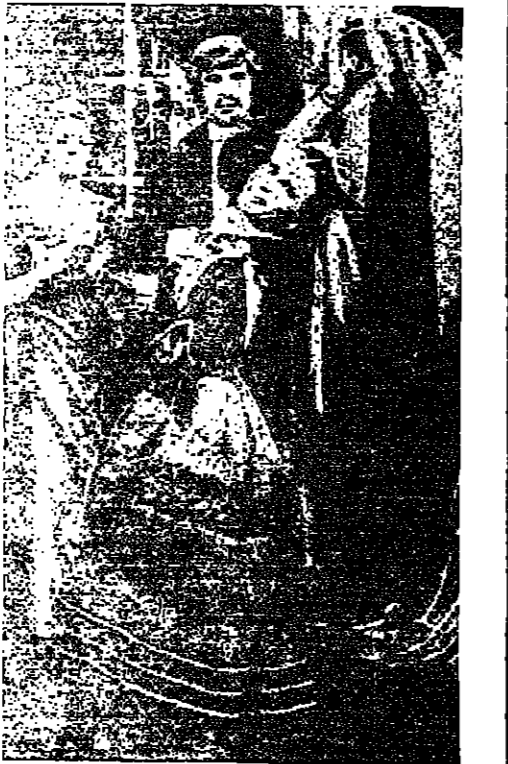
لقطة من فيلم « بيت الدمية » للمخرج عن مسرحية ايسن « بيت الدمية »

ومسرحية « كاتيلينا » ليست اول اعماله الادبية ، فقد كتب ايسن قبل ذلك عدة روايات ونشر عدة قصائد لم تصادف النجاح غير ان كاتيلينا اول مسرحية له تصادف شيئا من النجاح ، وهي بالمناسبة مأساة شعرية في ثلاثة فصول اعلن في حينه انها من وضع بريغولف بارم - وهو اسم ادبي مستعار . وقد كتبها وهو لم يتجاوز الثانية والعشرين من عمره وكان في ذلك الوقت قد اتجه الى كتابة المقالات الصحفية . غير انه في عام ١٨٥٩ اتجه الى عمل اخر اكثر قربا من اهتماماته ، حيث عين مديرا فنيا لاحد المسارح في بلدة « بيرجن » وقضى في هذا العمل احد عشر عاما حتى ١٨٦٢ .